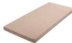
MA10 | MA15

Rimellen aus elastischem Eschenholz 7-fach gefedert auf Naturlatexstreifen in 2 Ebenen